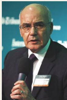
Ministro da Energia e Minas, Youcef Yousfi

Segundo declarações do Ministro da Energia e Minas, Youcef Yousfi, a Argélia descobriu recentemente reservas significativas de petróleo e gás natural numa grande unidade de exploração e, que podem ajudar a duplicar a produção de petróleo e gás do país na próxima década.